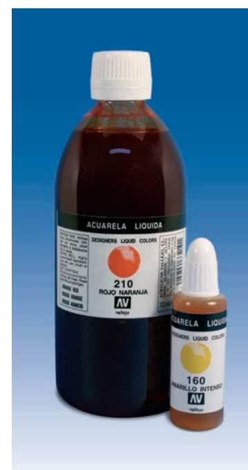
Acuarela en frasco de 32 ml. y botella 500 ml.

Brush Restorer: Products which cleans and restores fine watercolor brushes. Ref.28.890 in 85 ml.