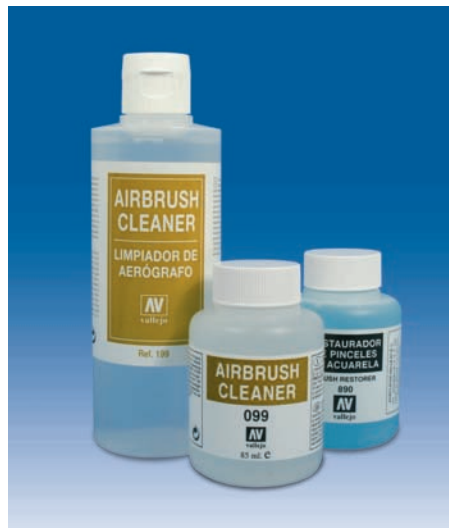
Limpiador de aerógrafos y restaurador de pinceles.

Restaurateur pour pinceaux: Produit qui nettoie et restaure les pinceaux de l'aquarelle. Ref. 28.890 en 85 ml.