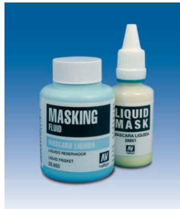
Máscara Líquida en frascos de 32 ml. y 85 ml.

Pinsel, Feder, Füller und Spritzpistolen: Wie normale Tinte kann Acuarela Líquida mit jedem beliebigen Zeichengerät verarbeitet werden.